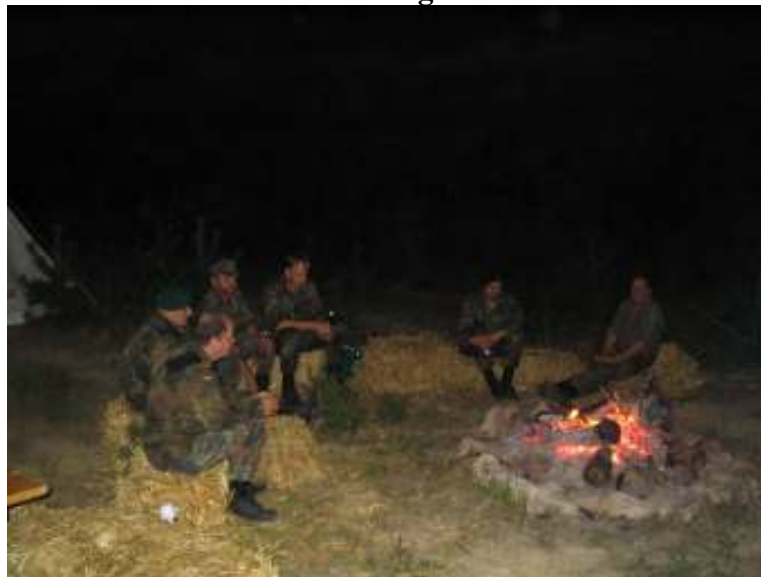
Entspannung nach dem Marsch.....