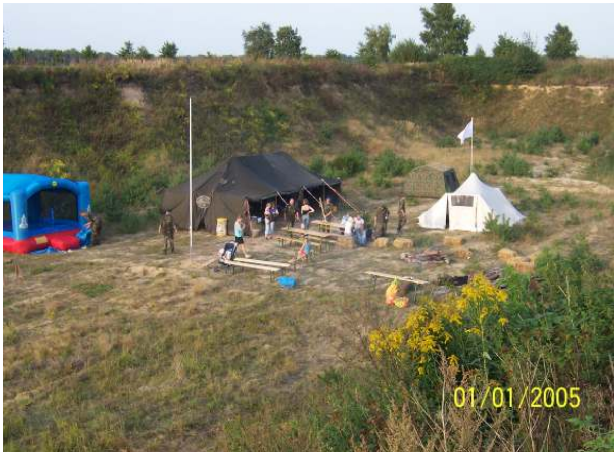
Die Ruhe nach dem Sturm.....