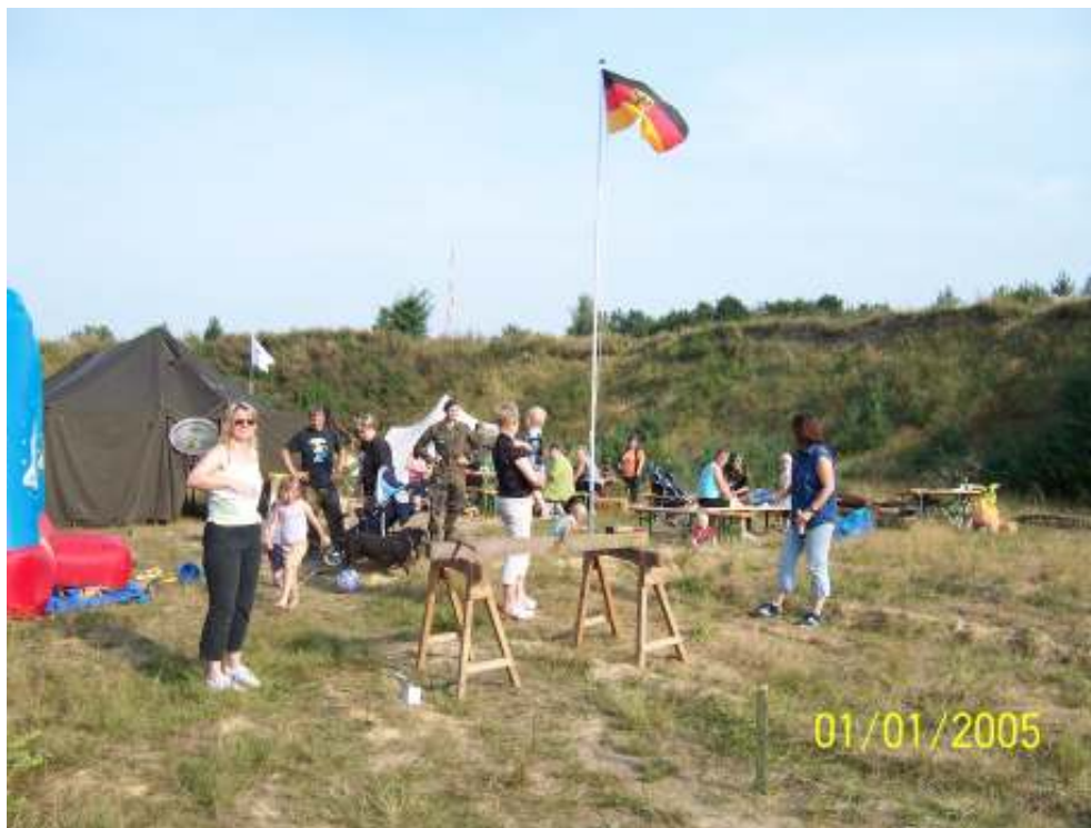
Leben beim Familientag....