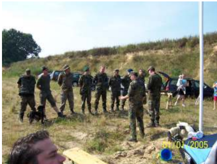
Bekanntgabe der Lage.....

ging es dann weiter zu einem gedeckten Feuerüberfall, aus Bäumen heraus, vom freien Feld und direkt vom Wegrand her wurde die Marschgruppe mit Feuerwerkskörpern unter Beschuss genommen. Bedingt durch die fortgeschrittene Dunkelheit hatte die Gruppe natürlich keine Chance diesem Überfall zu entgehen.