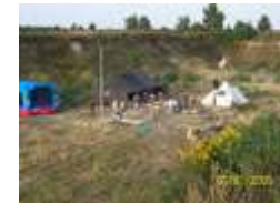
Nach dem Kinderfest