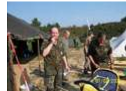
Spieß ratlos ????