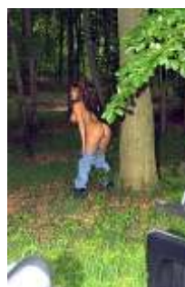
Feindberührung der besonderen Art.....