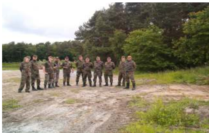
Eine voll motivierte Mannschaft.....