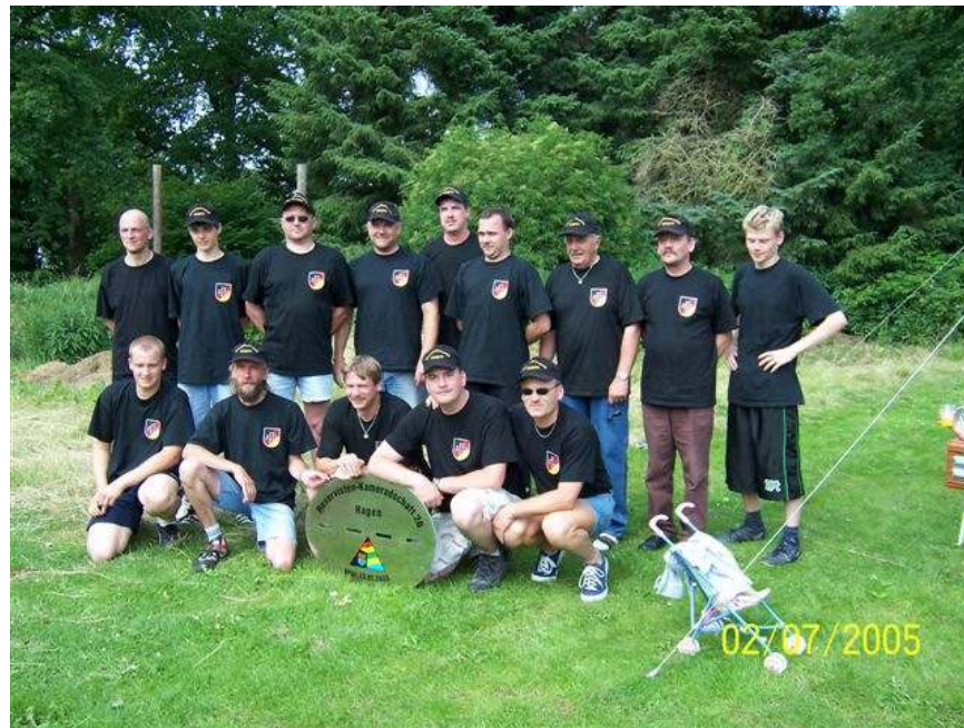
Die Mannschaft und "Betreuer"

Die Teilnahme an diesem Juxturnier war einfach ein "Muß" für uns. Auch wenn wir nicht so gut abgeschnitten haben, hat es einfach Spaß gemacht. Wir konnten hierbei auch unser neues RK-T-Shirt und unser Wappen in der Öffentlichkeit präsentieren !