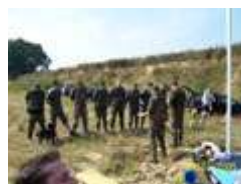
Lage und Auftrag...