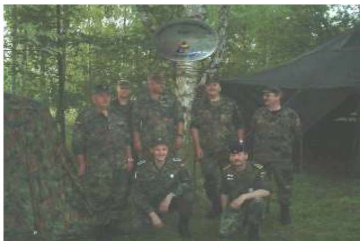
Mit unserer "Erkennungsmarke" beim Landesbiwak...