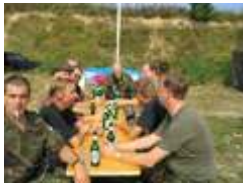
Nach dem Aufbau...