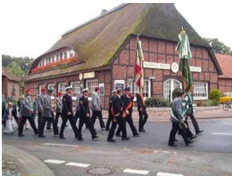
Während des Umzugs...

Bei dem Schützenfest des Schützenvereins Bramstedt hatten wir die Gelegenheit unser gutes Verhältnis zum Schützenverein Bramstedt noch weiter zu vertiefen. Wir nahmen mit 6 Reservisten und 2 Fördermitgliedern am Umzug durch das Dorf teil. Während die zwei Fördermitglieder die Fahne der Kyffhäuser Kameradschaft begleiteten, marschierten die uniformierten Kameraden zusammen mit der Patenbatterie 3./325, des Schützenvereins Bramstedt aus Schwanewede