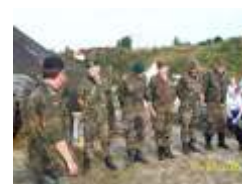
vor dem Marsch...