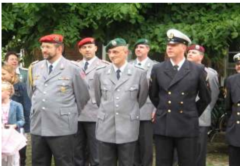
Antreten nach dem Königsumtrunk.....

Bei dieser Veranstaltung konnten wir auch einen Kontakt zur Patenbatterie 3./325 aus Schwanewede aufbauen. Das wird sicherlich eines Tages Früchte tragen, denn nur die aktiven Soldaten können uns Wissen über neue Waffensysteme vermitteln.