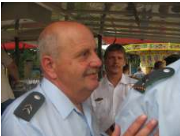
Ein Mariner lächelt nicht.....