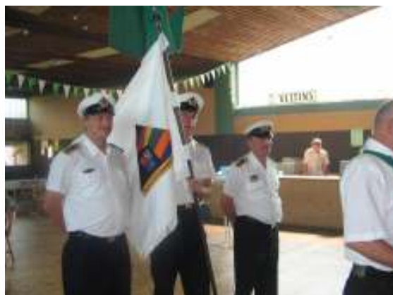
Kurz vor dem Fahnenausmarsch....