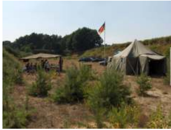
Das gesamte Camp.....