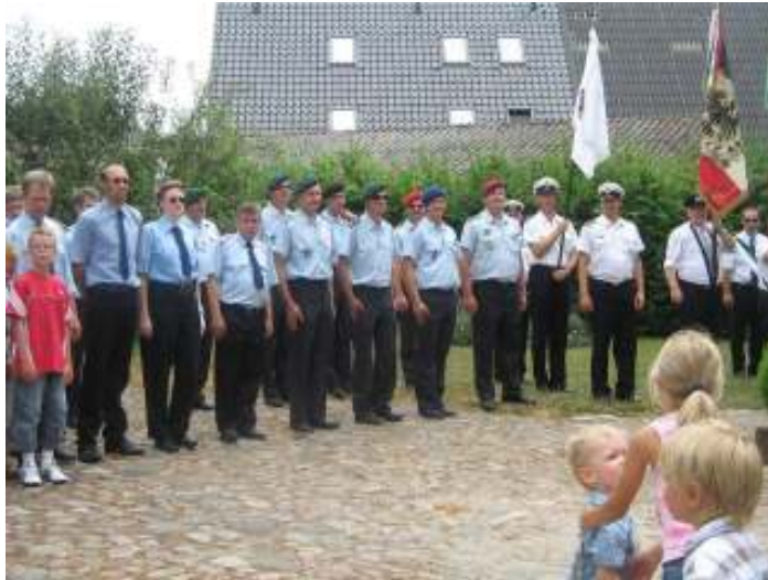
Niedersachsenhaus, der Durst ist gewaltig.....