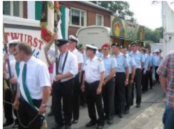
Nun geht's los.....