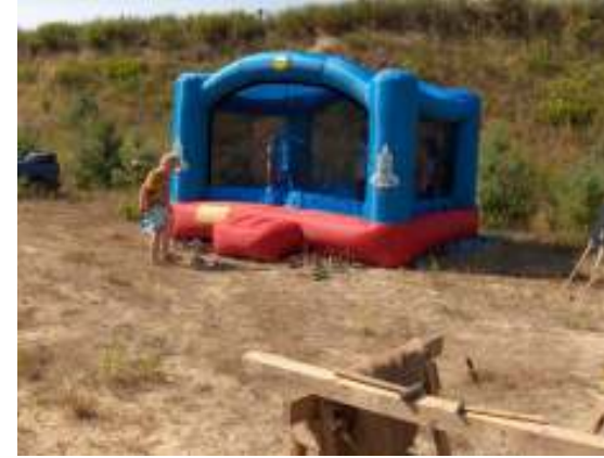
Hüpfburg und Nagelbalken