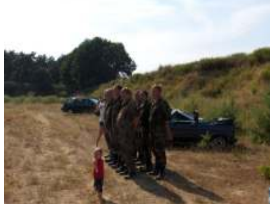
Jüngster Soldat vortreten.....