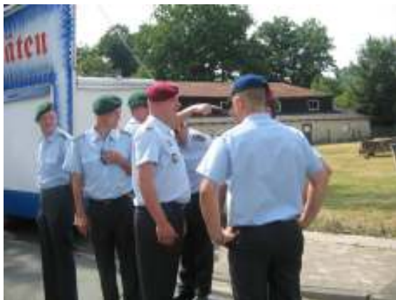
Wer gehört denn jetzt wo hin ??