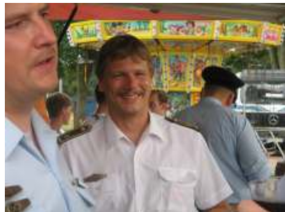
oder doch..... ??