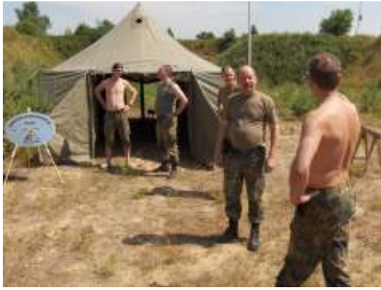
Zelt und Erkennungsmarke stehen.....