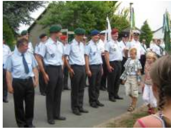
...zur Abholung der Kinderkönige