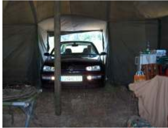
für den Kommandeurswagen ??