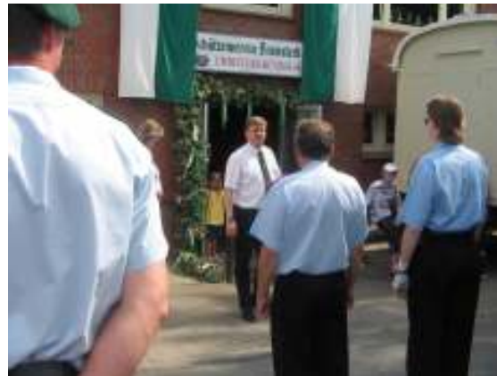
Der 1. Vorsitzende des SchV lässt antreten....